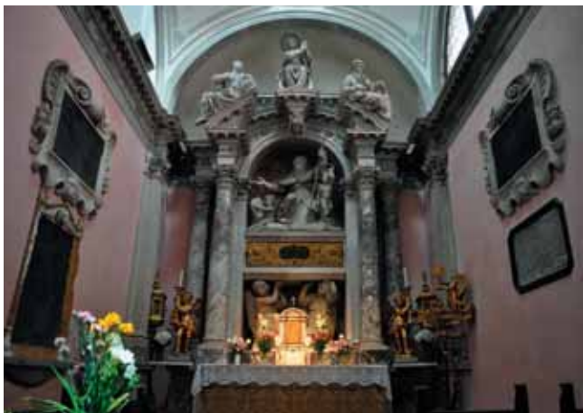
Oltar sv. Maksima z relikvijami v cerkvi sv. Kancijana v Benetkah.