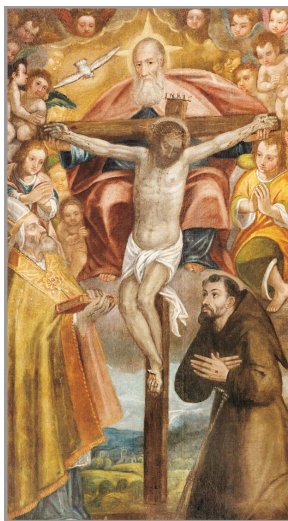
Antonio Moreschi, "Prestol milosti s sv. Florijem in sv. Fanciškom Asiškim", Lobarika, župnijska cerkev sv. Flora

malo: »Da je ta škof negoval emonsko cerkev, ni negotovo; vendar pa je neznano, v katerem času je živel. Njegove relikvije spoštljivo hrani mesto Pulj v Istri. Njegov letni praznik pa se slavnostno obhaja 27. oktobra.«