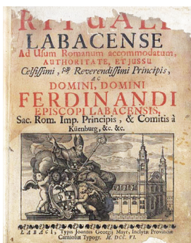
Rituale Labacensis, Obrednik ljubljanske škofije