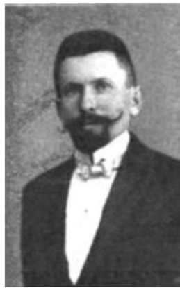
IVAN MILAVEC (1874. – 1915.) https://sl.wikipedia.org/wiki/Ivan_Milavec#/media/Slika:Ivan_Milavec.jpg

Ovaj rad posvećen je jednomu od najznamenitijih slovenskih orguljara – Ivanu Milavcu i njegovim najvažnijim orguljama, koje je izradio za katedralu sv. Nikole u Ljubljani.