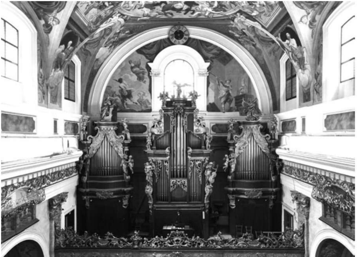
Slika 2: Milavčeve orgulje u ljubljanskoj katedrali (1911., op. 26), foto: p. Branko Petauer

Milavčeve orgulje u starim baroknim ormarima.