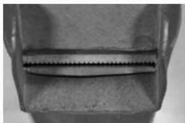
Slika 7: Kvintaten 8' sa I. manuala (ton H), foto: Aleš Razpotnik