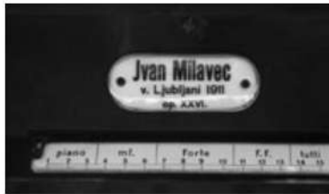
Slike 3, 4 i 5: Sviraonik

važnosti samokritike u planiranju obnove, prvi je korak prema željenom cilju.