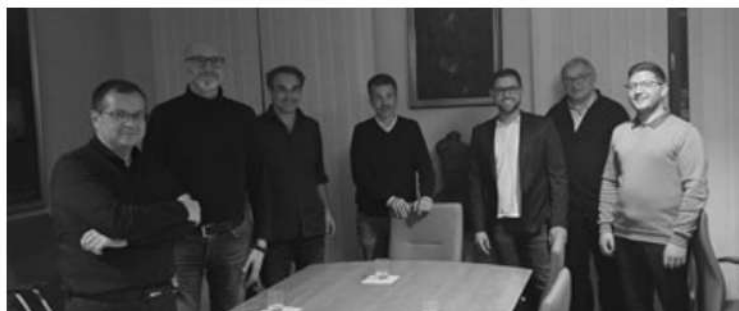
Slika 8: Komisija za obnovu orgulja u ljubljanskoj katedrali (ponedjeljak, 3. listopada 2022.)

da mjernih tehnika, koja ni na koji način nije utjecala na materijalni sadržaj instrumenta. Dokumentiranjem postojećega stanja instrumenta time je dana objektivna osnova za daljnja istraživanja.